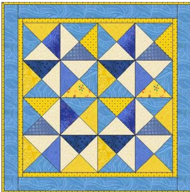
Tamanho do Quilt: 41" x 41" (ou aproximadamente 105cm) Tamanho Final do Bloco: 8" (20cm)

Um painel bem colorido. Azul e amarelo em vários tons. Faça os blocos e monte um painel cheio de cataventos. Arrume os blocos QST ou Ampulheta e forme cataventos.